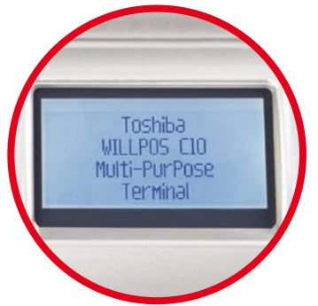
Visor de cliente integrado

Robusto y fiable, el WILLPOS C10 está diseñado para una amplia gama de aplicaciones y entornos - una verdadera solución multifuncional, con una estética cuidada, funcionamiento sin ventilador y tamaño reducido.