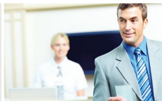
* Opción futura

Windows® 7 disponible para el WILLPOS C10 con una gama completa de opciones, visor de cliente integrado y lector de tarjetas. Sus dispositivos de comunicación y puertos COM * ampliables garantizan un sistema flexible y a prueba de futuro.