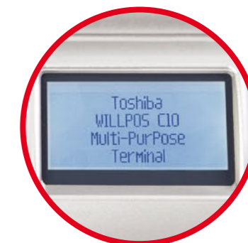
Visor de cliente integrado

Robusto y fiable, el WILLPOS C10 está diseñado para una amplia gama de aplicaciones y entornos - una verdadera solución multifuncional, con una estética cuidada, funcionamiento sin ventilador y tamaño reducido.