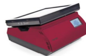
Tiendas de moda