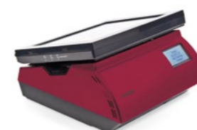
Tiendas de moda