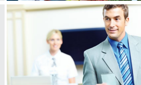
* Opción futura

Windows® 7 disponible para el WILLPOS C10 con una gama completa de opciones, visor de cliente integrado y lector de tarjetas. Sus dispositivos de comunicación y puertos COM * ampliables garantizan un sistema flexible y a prueba de futuro.