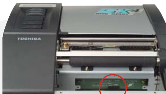
▲ Antena RFID UHF