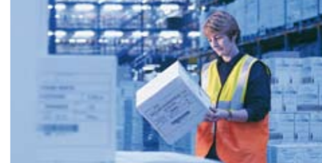
B-SX4 & B-SX5